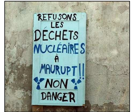
et à Maurupt-le-Montois

INADMISSIBLES, n'aient toujours ni répondu, ni agi dans les canons d'une saine démocratie ?