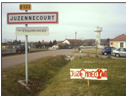
Campagne visuelle de résistance à Juzennecourt...

En juin dernier, 3115 municipalités réparties sur 20 départements recevaient un dossier beau comme un sou neuf, travaillé à souhait par une armada de "communicants" et présenté comme "une opportunité pour développer votre commune". Jusqu'à certains préfets qui s'étaient fendus d'une bafouille pour cautionner ce projet d'enfouissement pour déchets nucléaires au nom de code 'FAVL'.